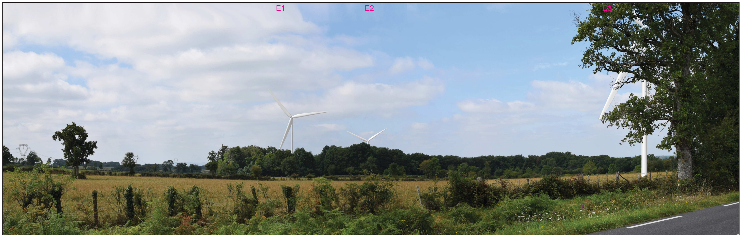
Vue réaliste photomontée (angle de vue 80°)

Le photomontage doit être observé à une distance de 24 cm pour correspondre à une vue réaliste (impression A3)